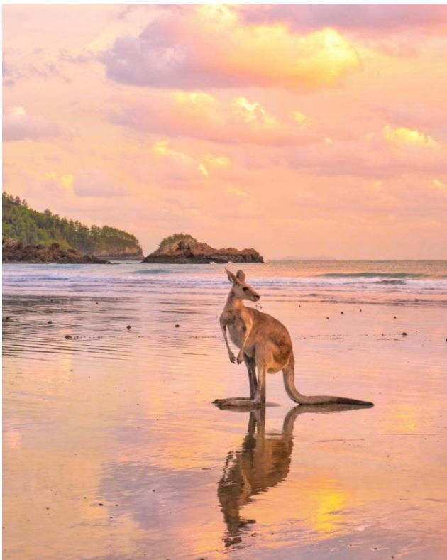
Queensland_Cape Hillsborough