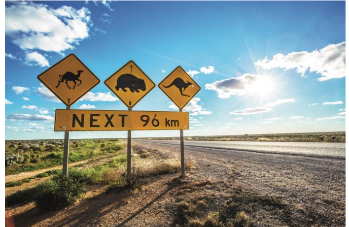
Nullarbor_Eyre Highway mit Roadsign_copyr_Greg Snell © Greg Snell