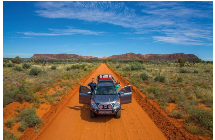
Northern Territory_Explorers Way_copyr_Tourism Northern Territory © Tourism Northern Territory